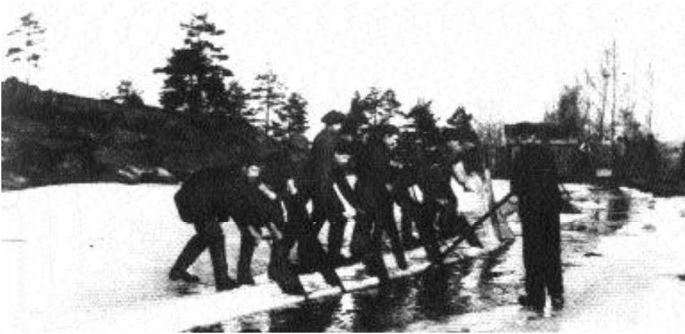
Isproduksjon og skipning ga arbeid til mange både til prepareringen av isen før oppkutting, til selve kapparbeidet til lagring og transport. På bildet skjæres blokker som fløtes i den åpne råka til ishuset hvor den ble lagret til skipning.

Isen måtte stelles og det ble arbeid av det. Den måtte feies og holdes rein, ( det skulle være ordentlig stålis.)