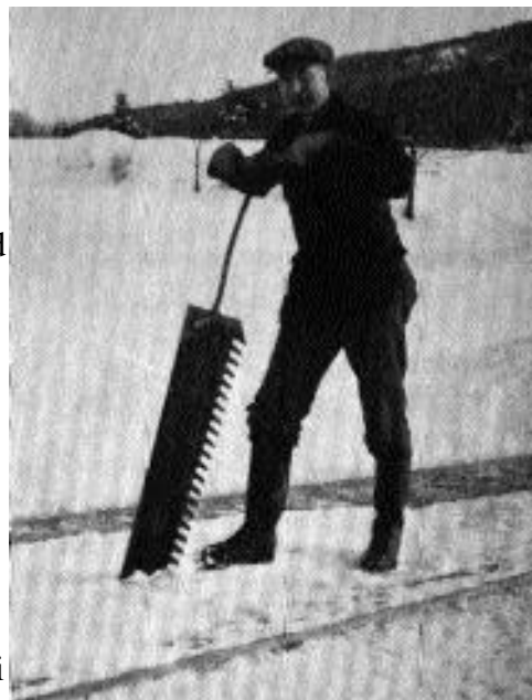
Isskjæring i fint vintervær.

kalte Syvertsvolldammen som i dag ligger som en synlig ruin, etter at den ble tatt av flommen. Oppe i enden av Raumyrdalen skal det ha ligget en stor dam, demmet opp med jord og tømmer.