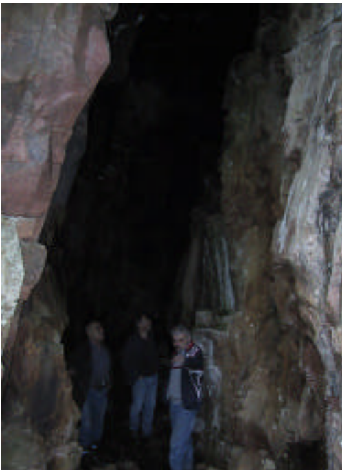
Ved inngangen til den største gruva i Seterdalen

Da anlegget var på det største skal det ha gått ei