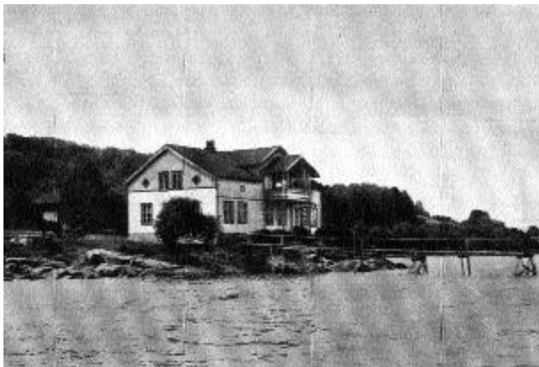
Bilde fra Tangen Gård fra omkring 1880.