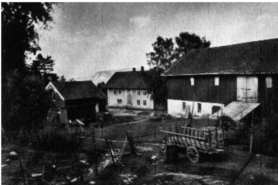
Bilde fra Tangen gård fra under eller før krigen.

bodde på Gullaug på andre sida av fjorden, sett rett nordover. Disse Tordenstjerner kom fra Bohuslän som dengang var norsk, og representerte det som ble betegnet lavadel.