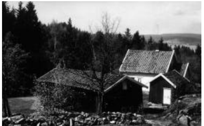
Lund etter påbyggingen i 59.