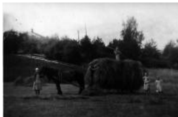
Høyonn i gamle dager.