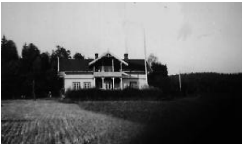
Øvre Helgerud, Bruk nr.3 Det gamle hovedhuset høsten 1942.

Betydningen av navnet er sannsynligvis. Helges rydning, og Helgerud er dermed en av de få gårdene i bygda som har opphav i et personnavn.