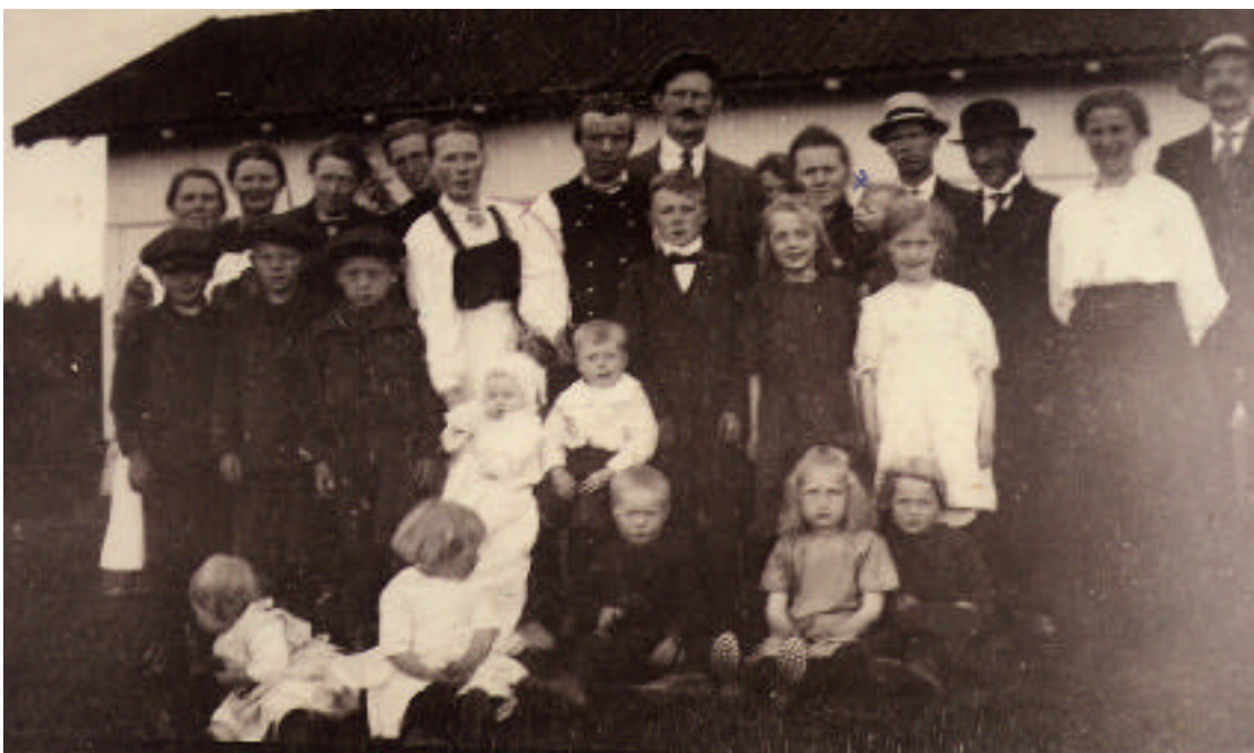
Barnedåp på Kjeldås i 1923