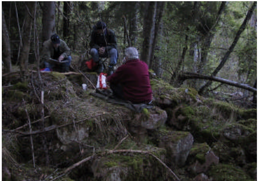
Kafferast på ruinene av Bråtaløkka.

Dette er jo ikke en gang en god historie, og den er virkelig dårlig hvis den er sann.