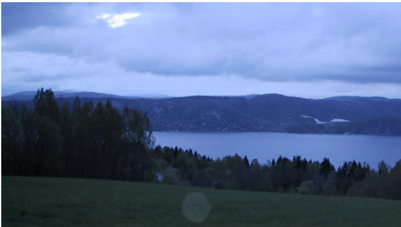
Utsikt i skumringen fra øvre Helgerud