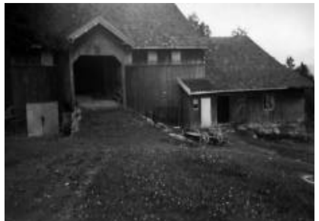
Låven på nedre Helgerud slik den engang så ut.