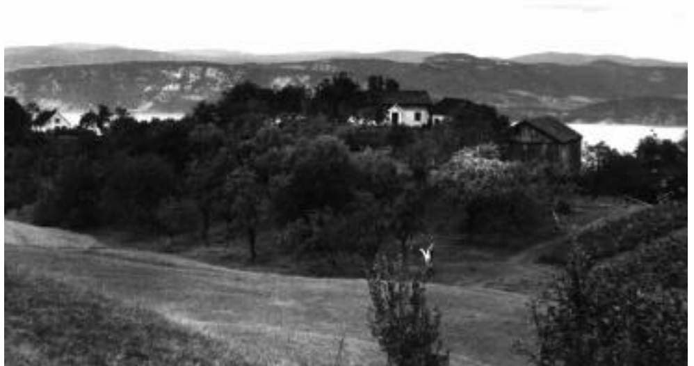
Helgerud bruk nr.1. (Kjeldås)

I 1907 får vi se en typisk transaksjon som er vel kjent fra flere gårder i