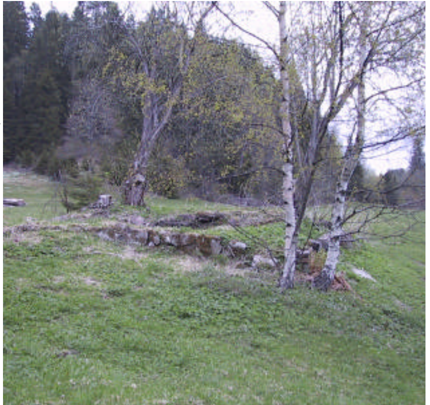
I dag er det kun rester igjen etter bebyggelsen i Stomperuddalen, her grunnmuren med kjellerhullet.