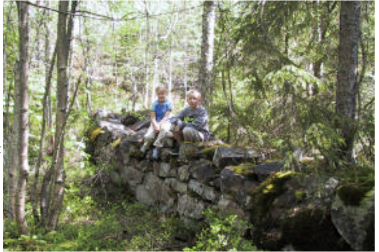
Demning etter sagbruket på Øksnavannet

Altså en ikke liten installasjon, som må ha ruvet godt i terrenget.