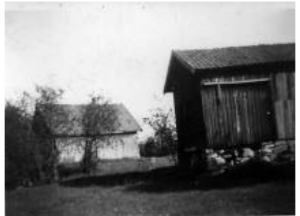
Lund, det opprinnelige huset.

Det må antas at bygningene i Lund ble satt opp i 1891-92, og at eiendommen ble drevet som eget bruk. Fjøset kan ha rommet 1-2 kuer, og det skal visstnok ha vært et par sauer der. Huset ble bygget i laftet tømmer m/panel, og inneholdt to rom + hems. I kjøkkenet gikk halvparten av plassen med til grue og stekeovn.