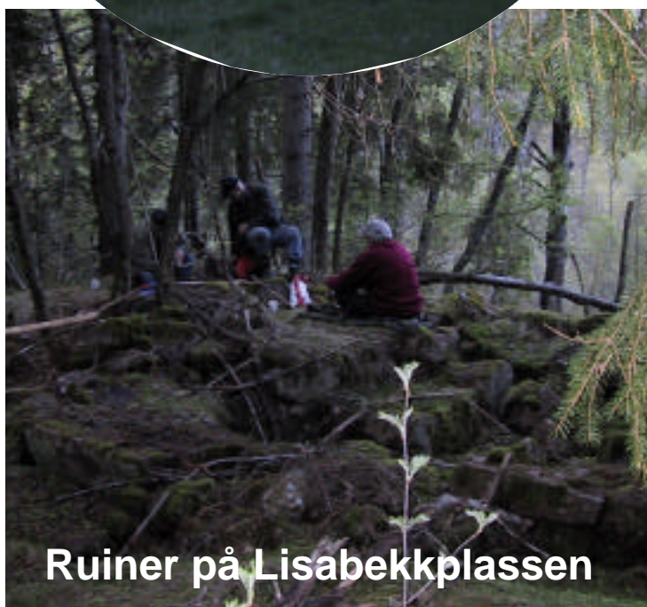
Ruiner på Lisabekkplassen