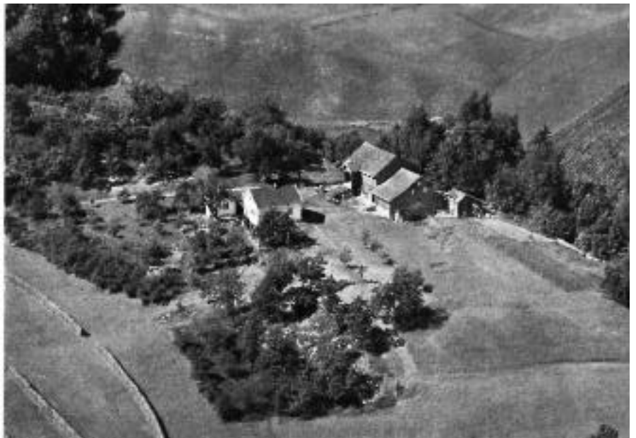
Bruk nr. 4 Nedre Helgerud