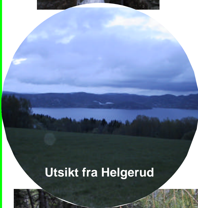
Utsikt fra Helgerud