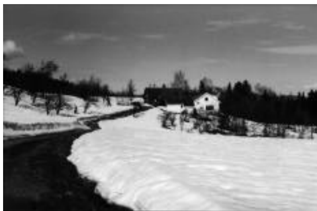
Våren er på vei til Nedre Helgerud